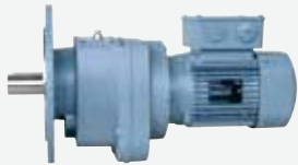
フランジ取付けギヤードモータ (プレミアム効率 IE3)