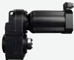
軸上取付けギヤードモータ (サーボモータ)