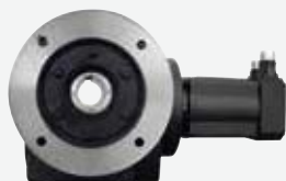
フランジ取付けギヤードモータ (サーボモータ)