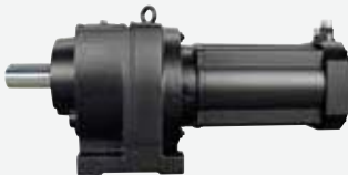
ベース取付けギヤードモータ (サーボモータ)