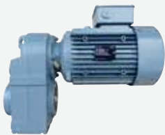
軸上取付けギヤードモータ (プレミアム効率 IE3)