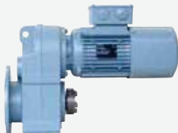
フランジ取付けギヤードモータ (プレミアム効率 IE3)