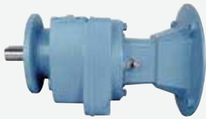
フランジ取付けギヤユニット (入力アダプタフランジ)