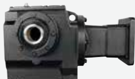
フランジ取付けギヤードモータ (入力サーボモータ用アダプタ)