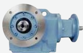
フランジ取付けギヤユニット (入力アダプタフランジ+軸)