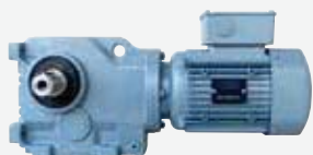
ベース取付けギヤードモータ (プレミアム効率 IE3)